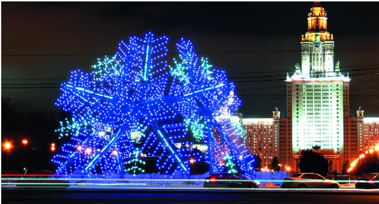
Светодинамическая ОДК «Три снежинки». Воробьевы горы.

ОДК «Три снежинки» представляет собой сложную светодинамическую композицию, состоящую из трех огромных восемнадцатиметровых снежинок. Каждая снежинка изготовлена из металлоконструкции с закрепленными на ней светодиодными элементами: лампами белого цвета, трёхцветными лампами с плавным изменением светового потока (бело-сине-розовыми), стробоскопами и светодиодными трубками с эффектом стекающей воды (сноуфолсами). Композиционно снежинки устанавливаются в трёх плоскостях, образуя единую конструкцию.