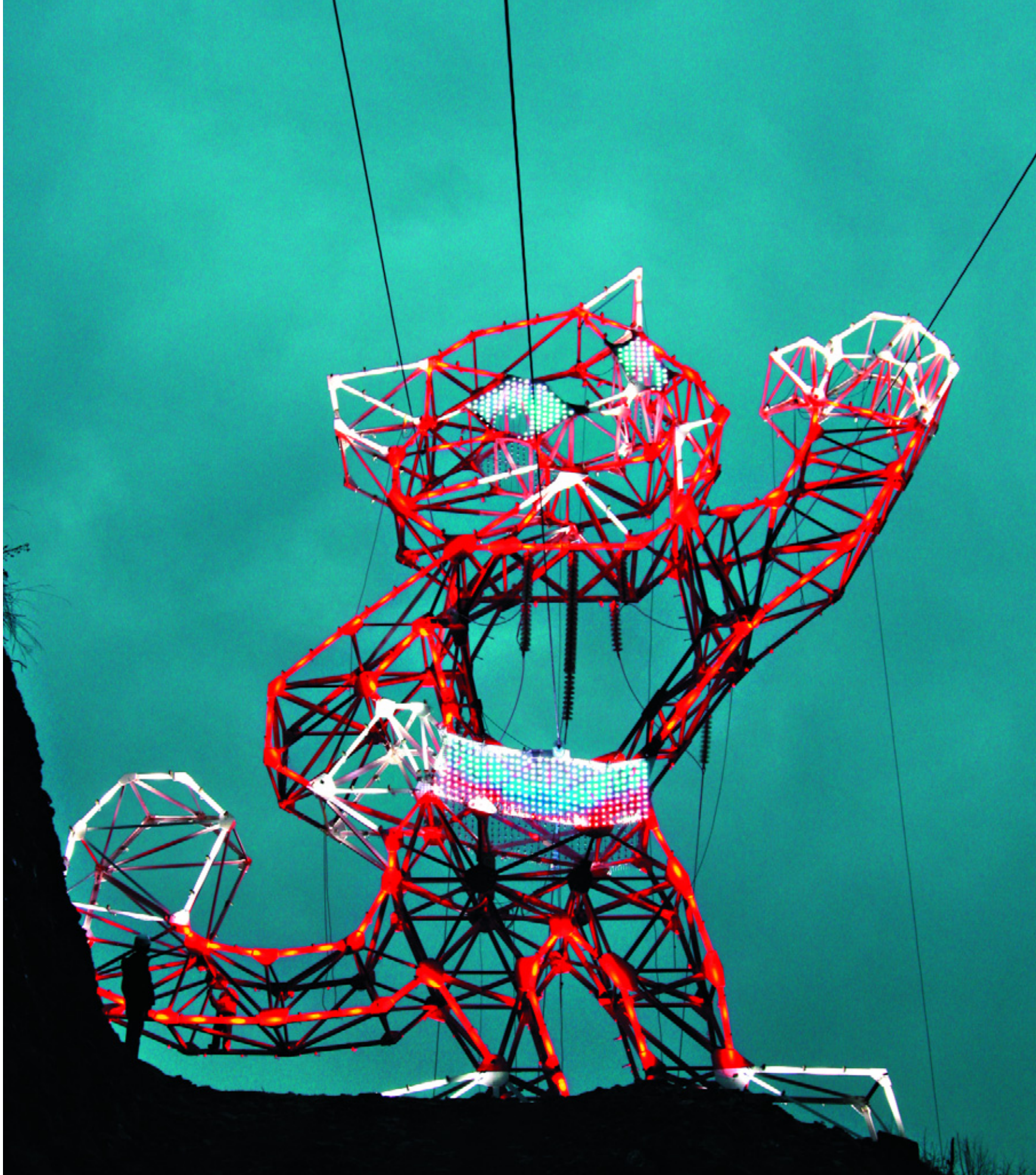
СИСТЕМА ПОДСВЕТКИ СВЕТОДИОДНЫМИ RGB ПРОЖЕКТОРАМИ ОПОРЫ ЛЭП В ВИДЕ БАРСА.