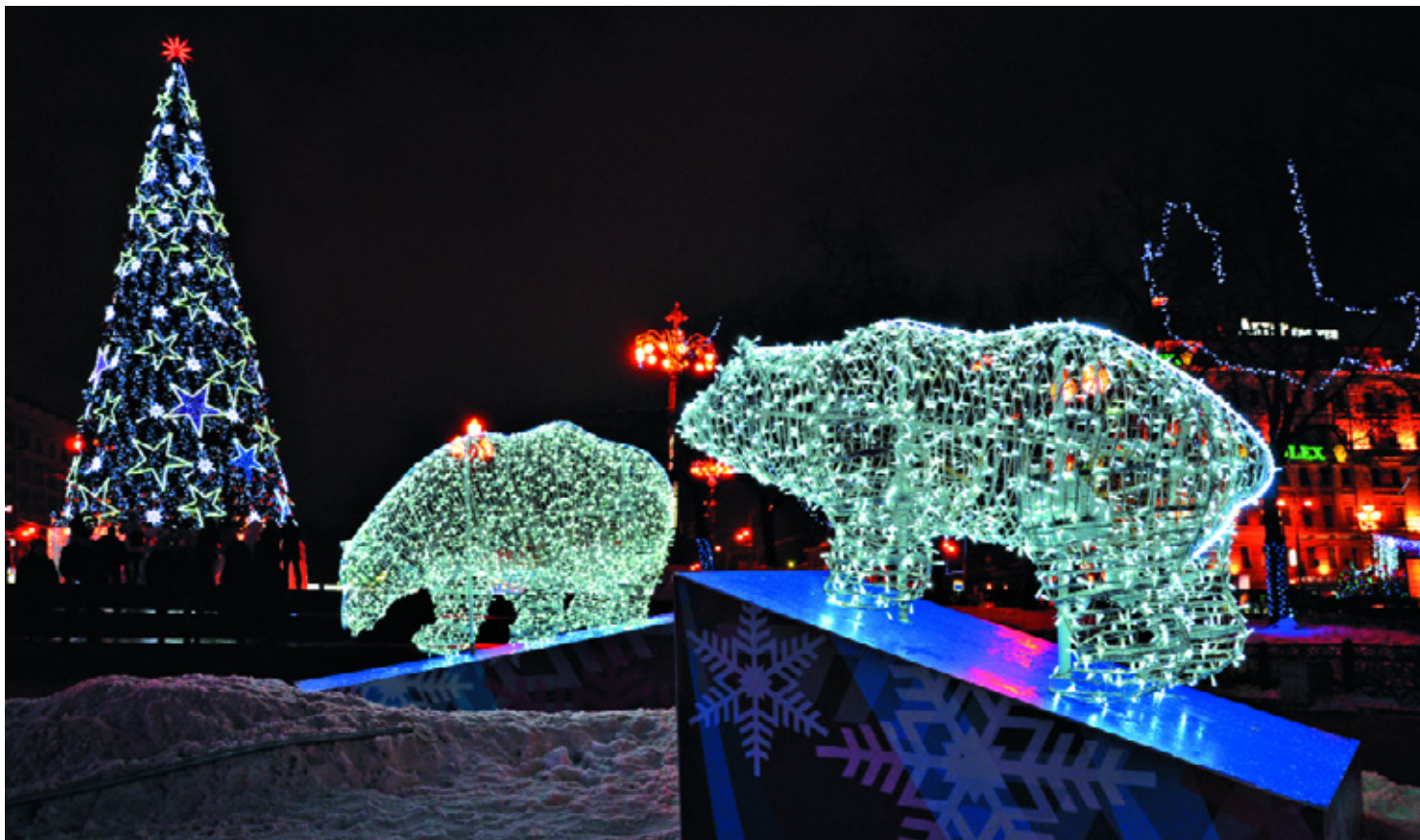
«Новогодняя сказка». Тверской бульвар.

Интерактивная ОДК «Новогодняя сказка» выглядит как сложная светотехническая композиция, состоящая из 10 групп фигур, скомпонованных по сюжетам, и установленная в пешеходной зоне бульварного кольца. Каждая фигура состоит из